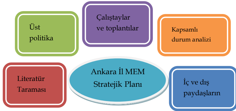
Şekil 1 :Stratejik Planlama Modeli

Stratejik planlama uygulamalarının başarılı olması, önemli ölçüde plan öncesi hazırlık çalışmalarının iyi planlanmış olmasına ve sürece katılımın üst düzeyde sağlanmasına bağlıdır.